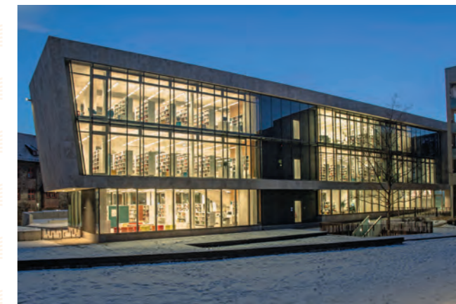
Stadtbibliothek Nordhausen 2017

Annika Brandt, Bundeszentrale für politische Bildung (bpb)