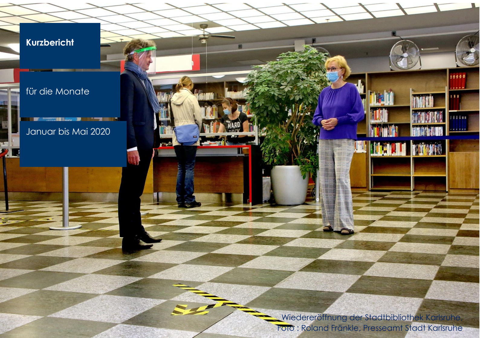
Wiedereröffnung der Stadtbibliothek Karlsruhe